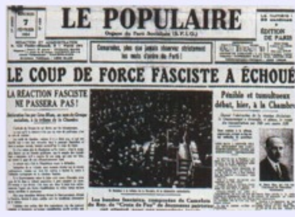
JOURNAL DE LA SFIO (PARTI SOCIALISTE)