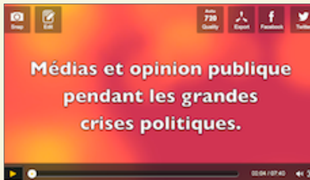
1° VIDEO DU COURS