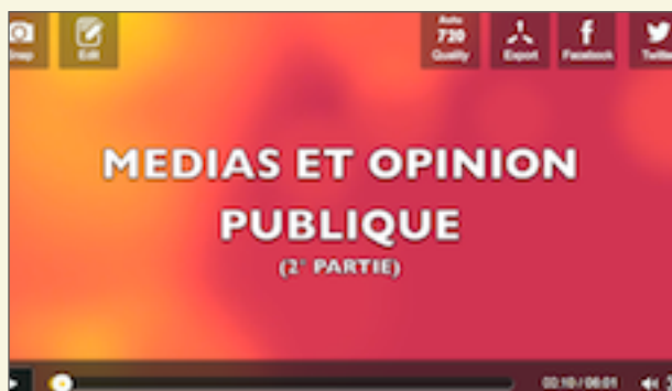
2°VIDEO DU COURS