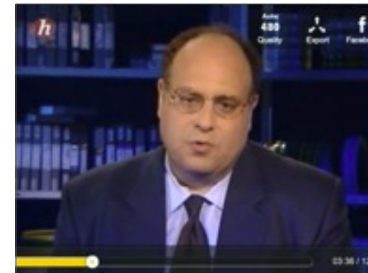
VIDEO explicative le 6 février 1934