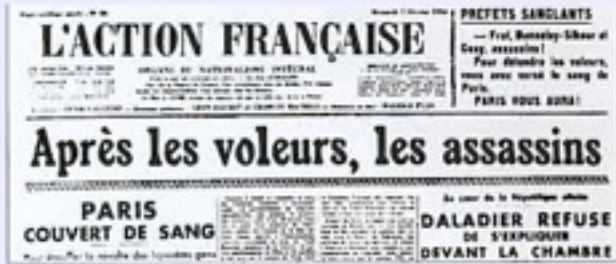
JOURNAL DE L'EXTRÊME DROITE