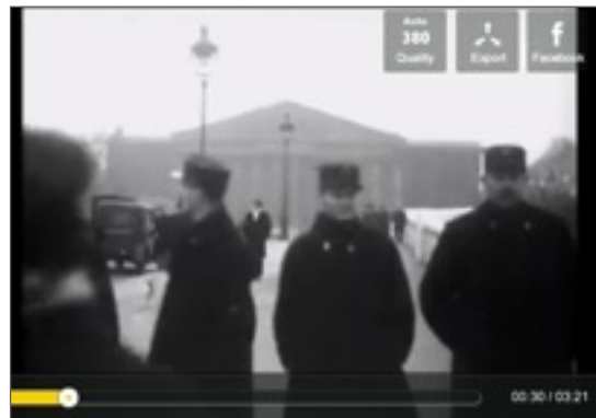
VIDEO d'actualité le 6 février 1934